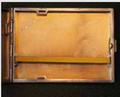
Papierośnica - strona wewnętrzna, 13 XI 1943 r.