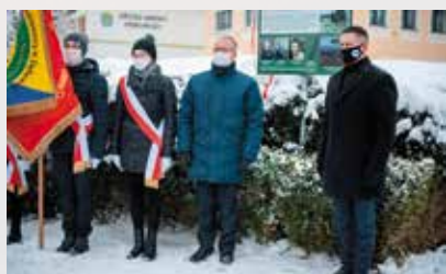
Odsłonięcie tablicy przez Wójta oraz Starostę