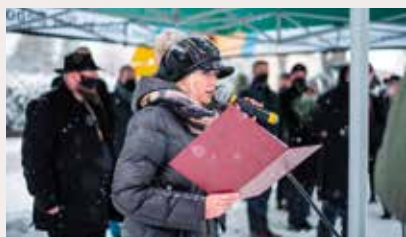
Dyrektor GOKSiT przywitanie gości