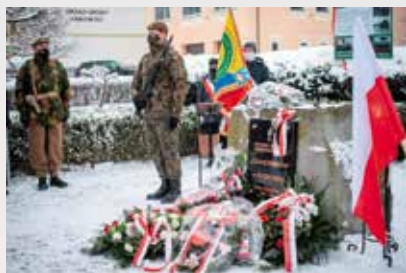
Warta honorowa 133. Batalionu Lekkiej Piechoty