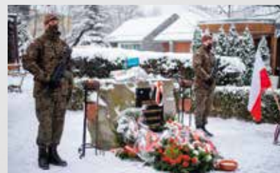
Warta honorowa 133. Batalionu Lekkiej Piechoty