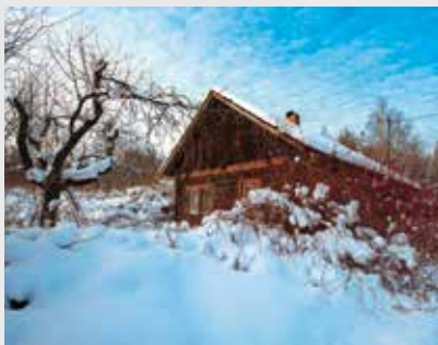
Chałupa kiero ciepła sie im na łośczy