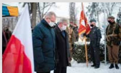
Delegacja Starostwa Powiatowego w Cieszynie