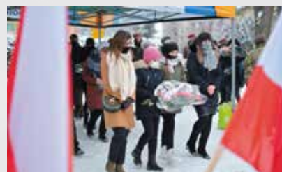
Delegacja Klubu Cichociemnych składa kwiaty