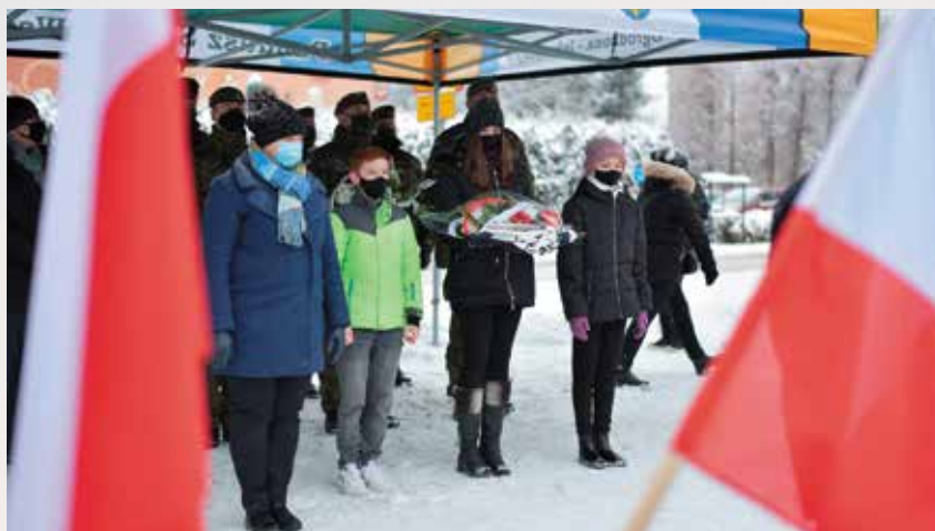
Delegacja ze Szkoły Podstawowej w Dębowcu składa kwiaty przed pomnikiem upamiętniającym Cichociemnych

Z okazji obchodów Dnia Patronów Szkoły na stronie internetowej naszej placówki ogłoszone zostały konkursy skierowane do uczniów klas młodszych oraz starszych. Były to: - konkurs na prezentację multimedialną o tematyce pierwszego zrzutu Cichociemnych w Dębowcu dla uczniów klas VII – VIII,