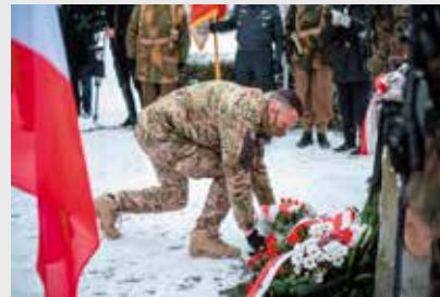
Delegacja JW Agat składa kwiaty