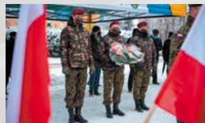
Składanie kwiatów przed pomnikiem

Bezpłatny Informator Gminy Dębowiec „Dębowieści”