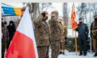
Żołnierze 133. Batalionu Lekkiej Piechoty