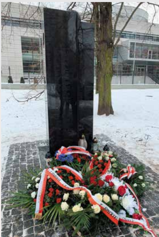
Uroczystości w Warszawie z okazji 80. Rocznicy Pierwszego Zrzutu Cichociemnych.