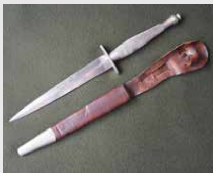
Sztylet F-S 2, majora St. Krzymowskiego.