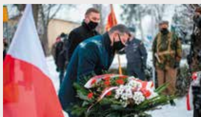
Delegacja INP składa kwiaty