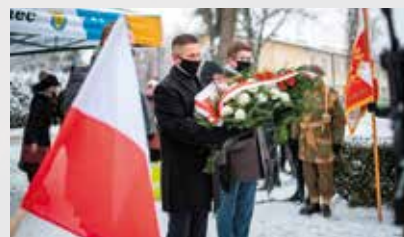
Delegacja UG w Dębowcu składa kwiaty